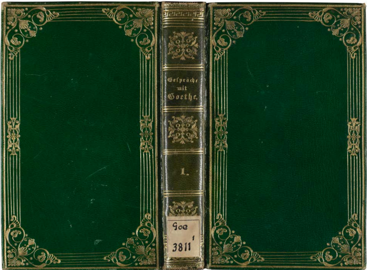
Einband zu den Gesprächen mit Goethe